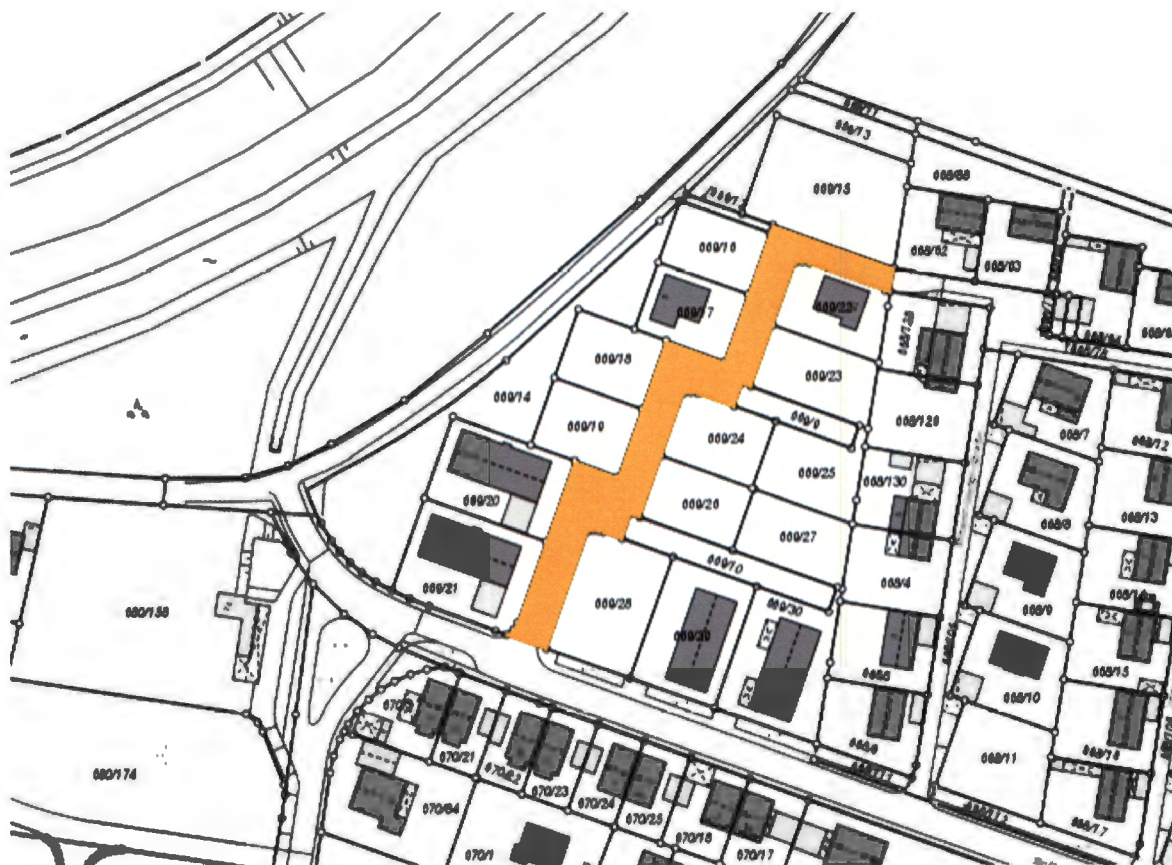
(Abb. Rudolf-Ismayr-Weg )