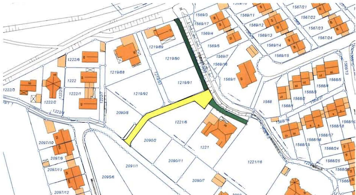
Abb. 2 ( Mooswiesenweg –Stichstraße; vgl. Plan Markierung gelb)

Betreff: Widmung des Mooswiesenweg im räumlichen Geltungsbereich des Bebauungsplanes Nr. 02-11/1a „ Östl. der Bahnlinie, zwischen Flutmulde und Rennweg “ (Deckblatt Nr. 9)