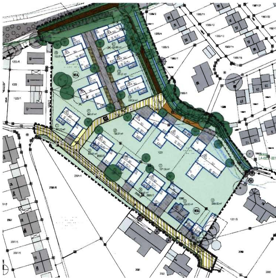
Abb. 3 (Bebauungsplan Nr. 02-11/1a, Deckblatt Nr. 9)

Betreff: Widmung zum beschränkt-öffentlichen Weg am Mooswiesenweg aufgrund der Festsetzung im Bebauungsplan Nr. 02-11/1a „ Östl. der Bahnlinie, zwischen Flutmulde und Rennweg “ (Deckblatt Nr. 9) für die in Abb. 2 hellgrün markierten Flächen als „ öffentlicher Fuß- und Radweg, für die Parzellen 6 und 7 als Grundstückszufahrt nutzbar “ und für die ebenfalls in Abb. 2 dunkelgrün markierten Flächen als „ öffentlicher Fuß- und Radweg, wassergebunden / Schotterrasen “