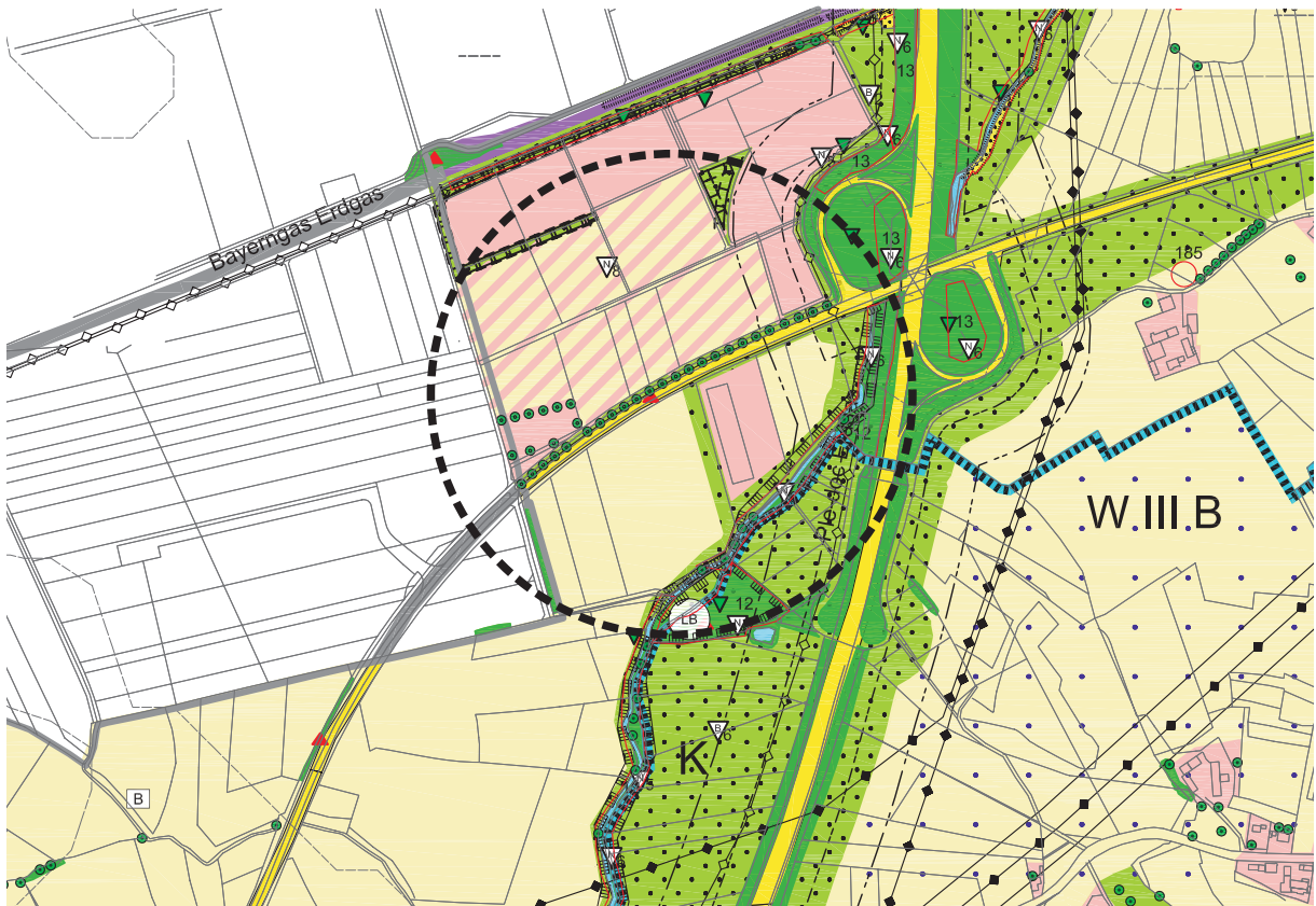
Änderung Landschaftsplan mit Deckblatt Nr. 36 im Bereich "An der Stadtgrenze - südl. der Bahnlinie München - La - nördl. St2045"