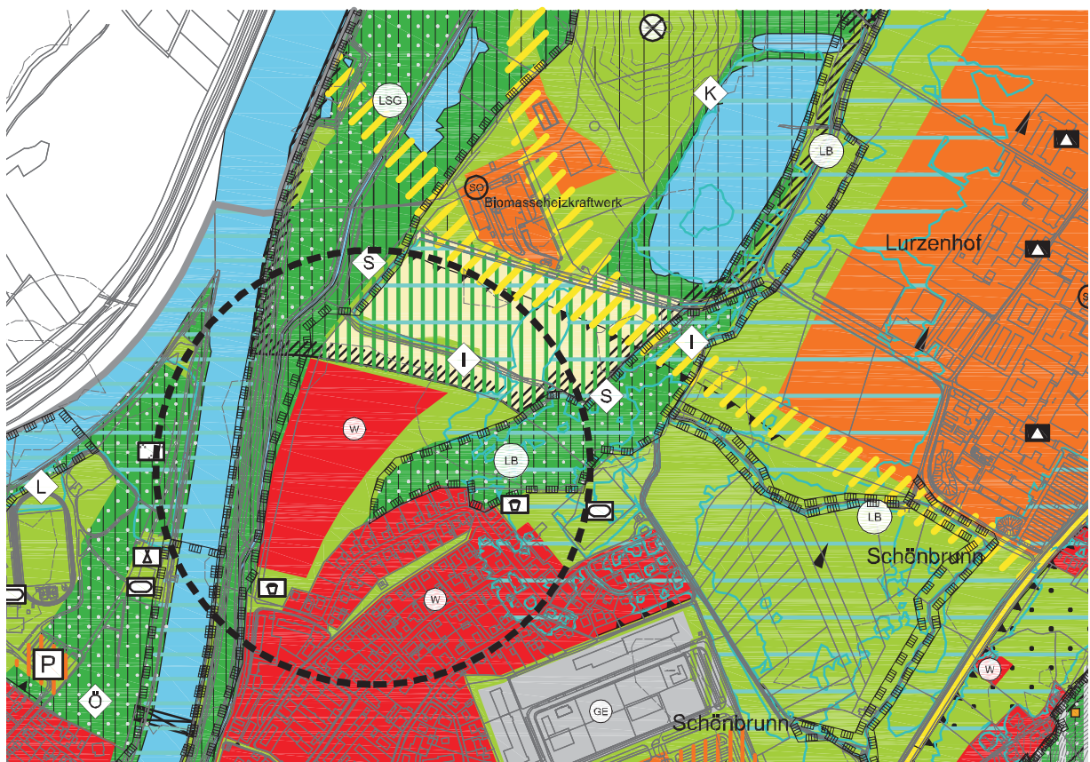
Änderung Flächennutzungsplan mit Deckblatt Nr. 24 im Bereich "Schönbrunner Wasen"