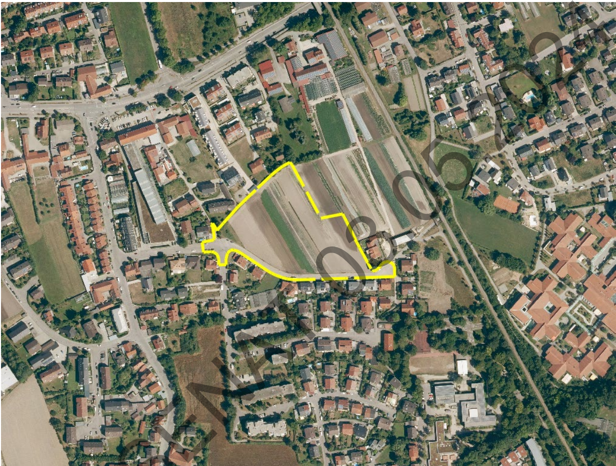
Luftbild, Planungsbereich gelb gestrichelt

Das Planungsgebiet liegt im Stadtteil Landshut-West und betrifft die Flurnummern 2161, 2161/1, 2193/6, 2193/7, 2193/10 und 2196/2, jeweils der Gemarkung Landshut. Es umfasst insgesamt eine Fläche von 18.303 m 2 . Im Osten wird das Planungsgebiet durch landwirtschaftliche Nutzflächen und im Süden, Norden und Westen durch die bestehende Bebauung im Bereich der Haydnstraße und des Rennwegs begrenzt.