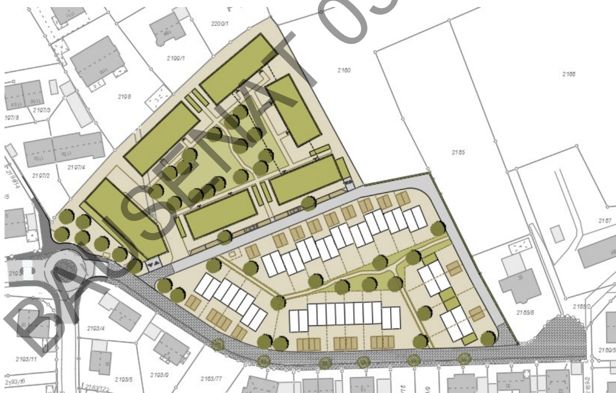
Städtebauliches Planungskonzept der Stadt Landshut

Ziel der Planung ist die Entstehung eines ökologisch wertvollen Quartiers, welches das Bindeglied zu dem bereits im Norden vorhandenen Geschosswohnungsbau und der kleinteiligen Bebauung aus Einfamilien- und Doppelhäusern im Süden darstellen soll. Im Vordergrund des Konzeptes steht sowohl die Schaffung von Aufenthaltsqualität wie auch eine optimierte Durchgrünung und Durchlüftung.