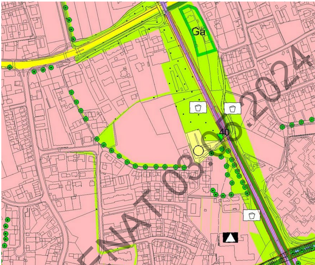
Landschaftsplan der Stadt Landshut, Stand April 2022

Der Landschaftsplan beschreibt den Geltungsbereich ebenfalls als Siedlungsfläche sowie im Westen des Planbereichs mit einer gliedernden und abschirmenden Grünfläche.