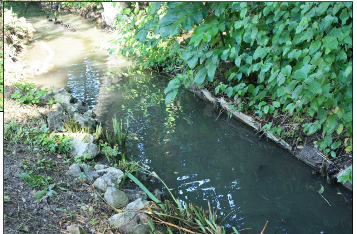
Starke Sedimentbildung: Schlammschicht bis 50 cm tief