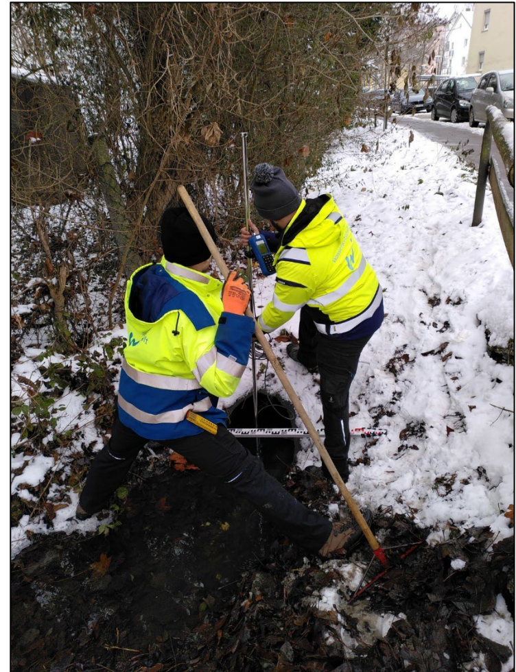
Abflussmessungen – Mitarbeiter des Landshuter Wasserwirtschaftsamtes - Dezember 2022