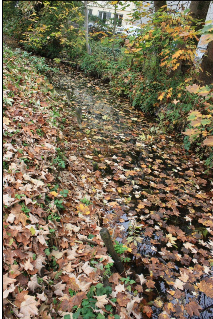
Überdeckung des aquatischen Lebensraumes – Oktober 2022