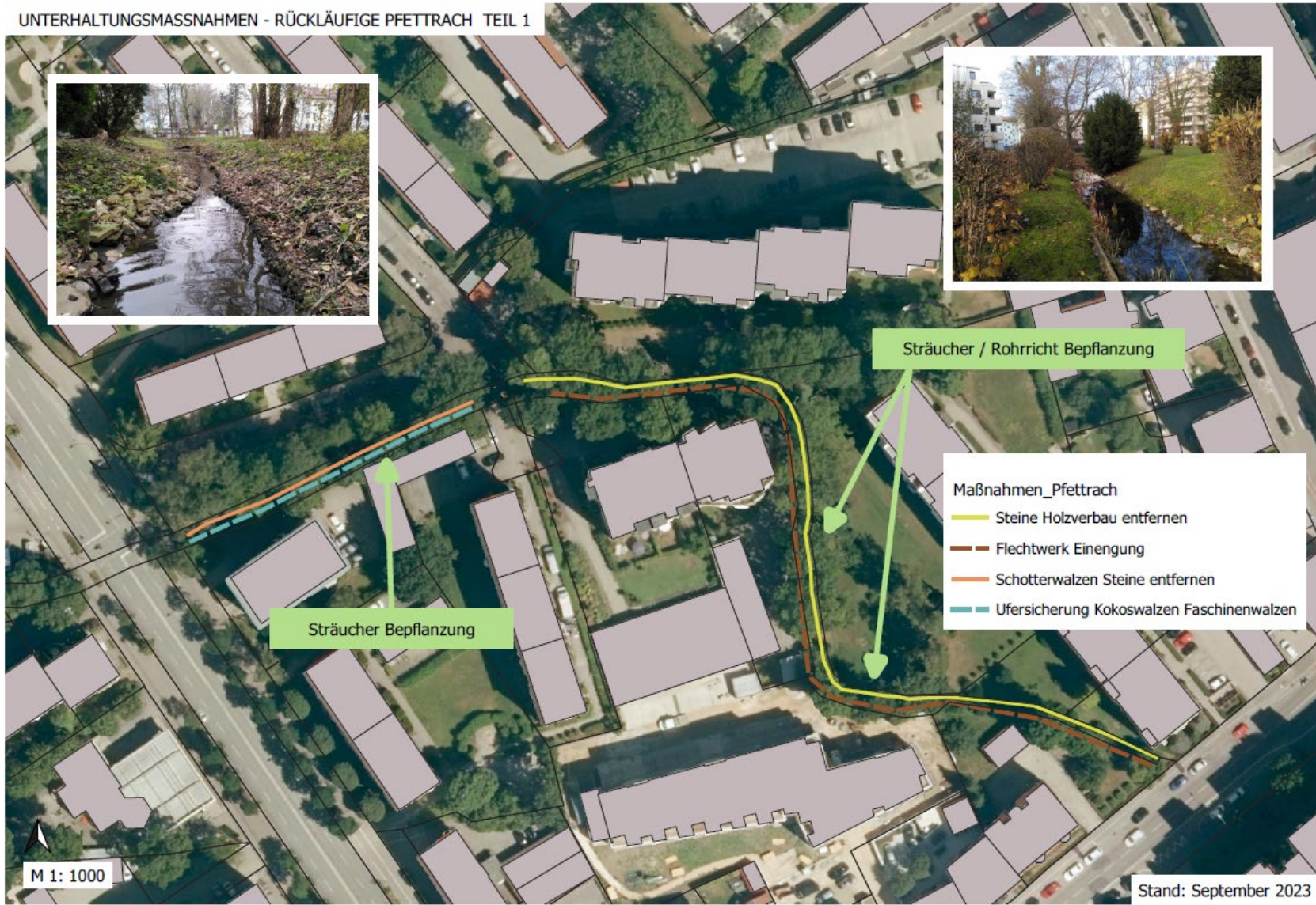
Beispiel der erarbeitende Renaturierungsmaßnahmen