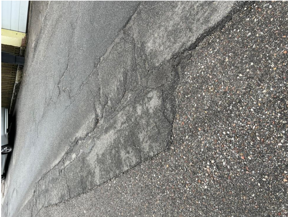
Anja König (SPD)