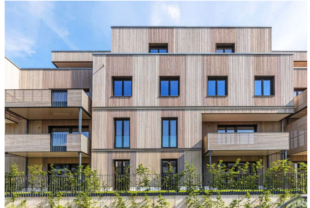
Quelle: BUWOG Lotsenhäuser in Berlin-Grünau