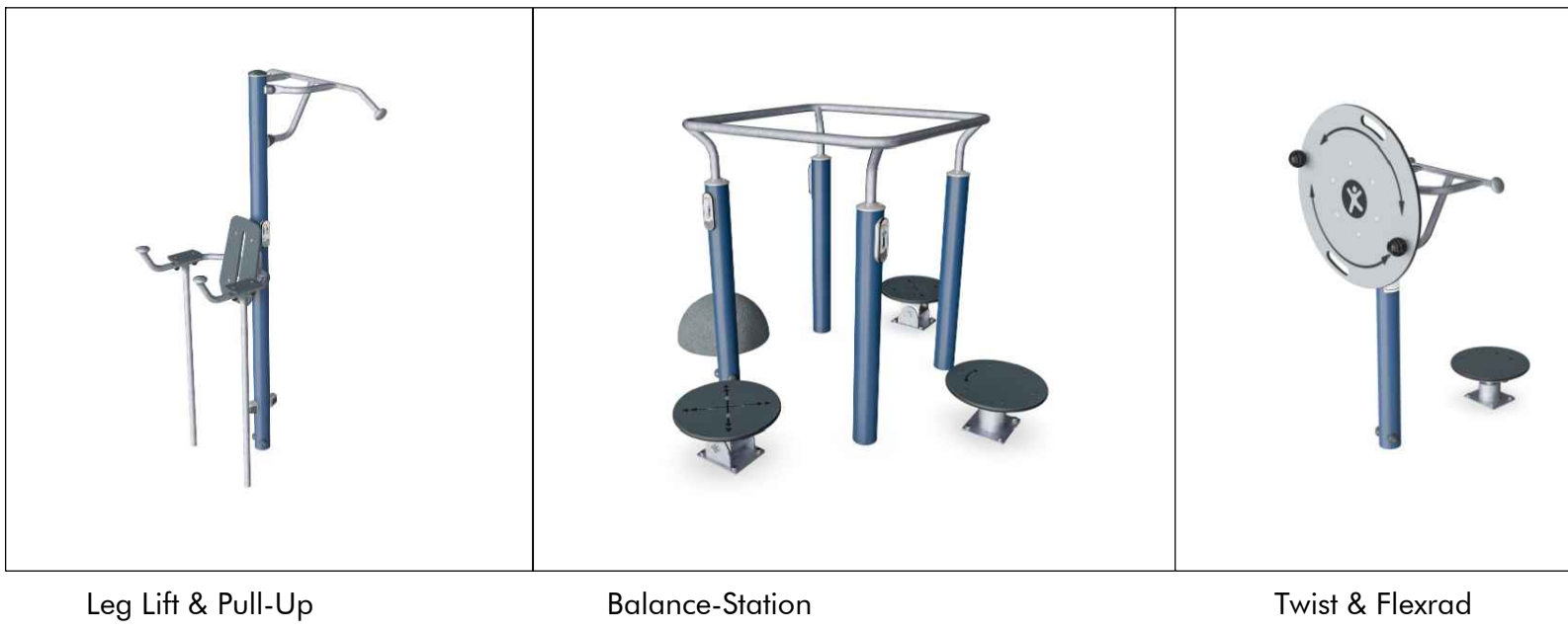
Leg Lift & Pull-Up