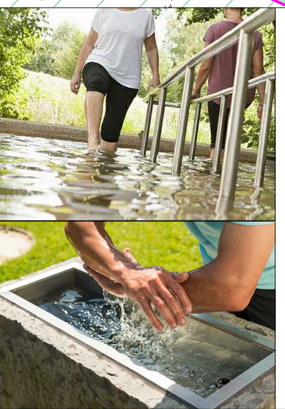
Kneipp-Bereich mit Wasseranwendungen für Beine und Arme.