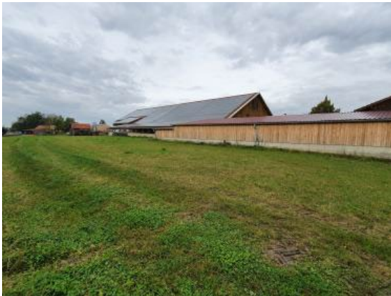
Blick vom Flurweg nach Nord-Westen