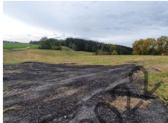
Blick vom Flurweg nach Süd-Westen

Die Auswirkungen des Eingriffs auf das Schutzgut Landschaftsbild sind unter Berücksichtigung der Ausgangssituation und der Vermeidungsmaßnahmen von geringer Bedeutung .