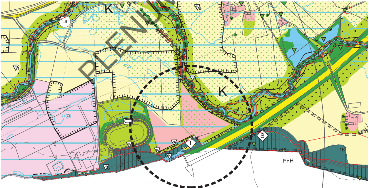
Änderung Landschaftsplan mit Deckblatt Nr. 71 im Bereich "Nördlich der A92 zwischen Speedwaystadion und Klötzlmühlbach"