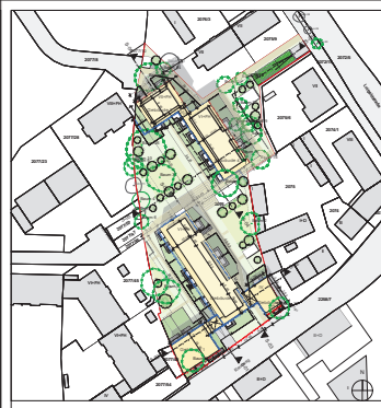
Übersichtsplan M 1:1000