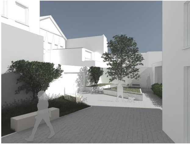
3D-Auszug der Vorentwurfsplanung

Die Vorstellung der aktuellen Vorentwurfsplanung und der dazugehörigen Kostenschätzung erfolgt in der Bausenatssitzung durch den Freianlagenplaner.