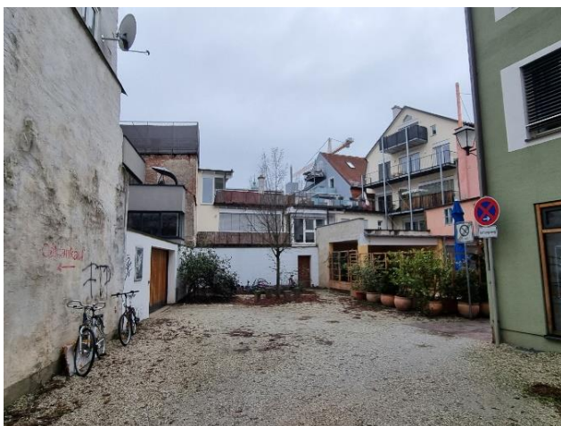
Aktuelle Aufnahme Quartiersplatz

Im Zuge des Sonderfonds „Innenstädte beleben“ wurde bereits der Förderantrag eingereicht. Die hier in Aussicht gestellte Zuwendung beträgt insgesamt 80% der Bausumme.