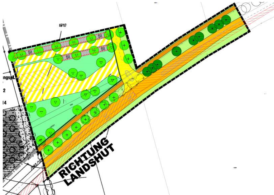
Abb. 1 (Bebauungsplan Nr. 10-6/Ausschnitt)

Es wurde festgestellt, dass die im räumlichen Geltungsbereich des Bebauungsplanes Nr. 10-6 festgesetzte Verkehrsfläche noch nicht gewidmet ist.