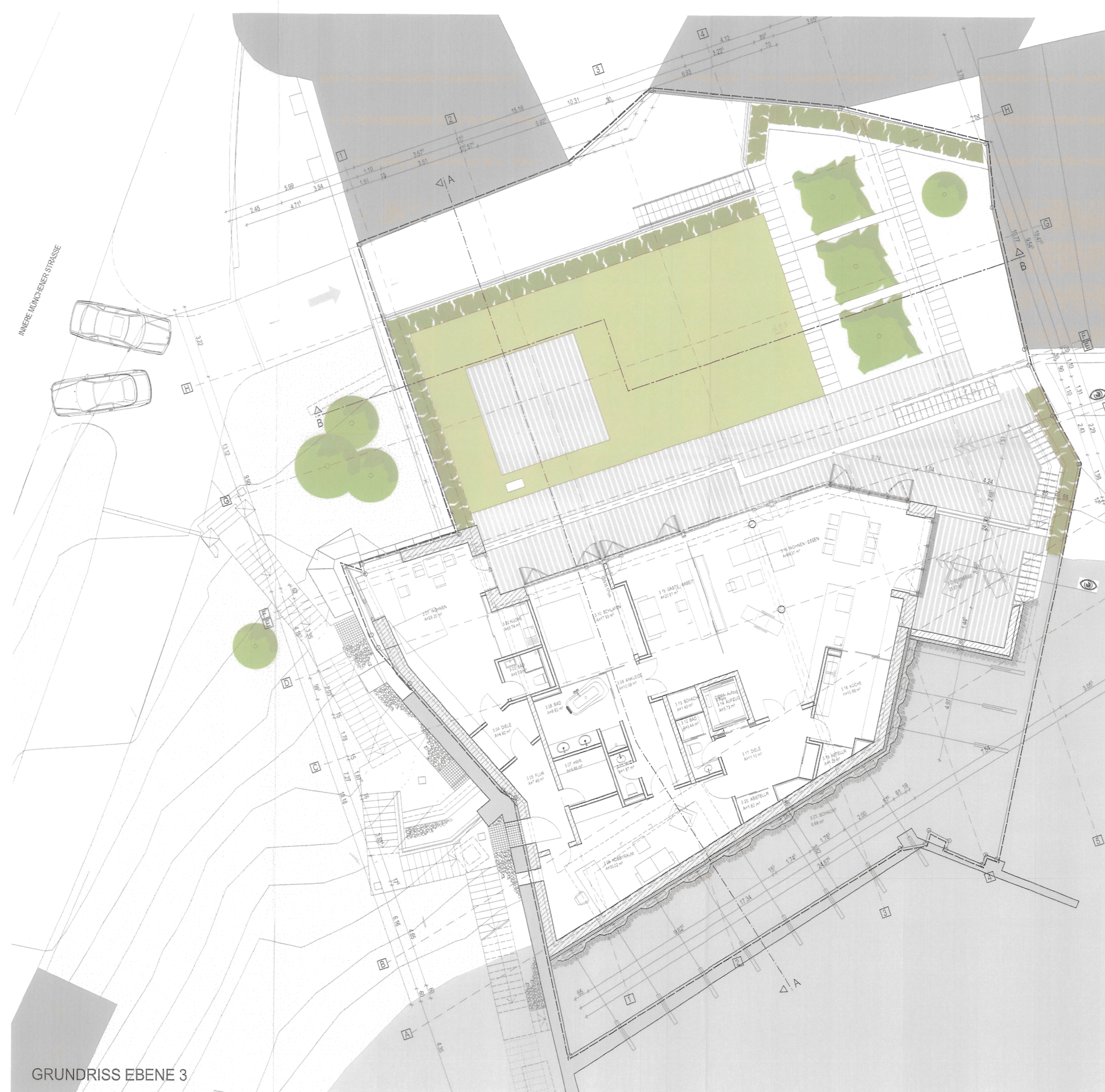
GRUNDRISS EBENE 3