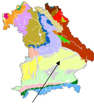
Hydrogeologischer Teilraum Fluvioglaziale Schotter

Der Geltungsbereich liegt in der hydrogeologischen Einheit fluvioglaziale Ablagerungen (Schmelzwasserschotter) und kann als Poren-Grundwasserleiter mit hohen bis sehr hohen Durchlässigkeiten charakterisiert werden. Aufgrund der geologischen Ausgangssituation und der damit bedingten geringeren Rückhaltefähigkeit gegenüber Schadstoffen sind die Grundwasservorkommen in der Regel empfindlicher gegenüber Schadstoffeinträgen. Gleichzeitig besteht eine überwiegend hohe relative Grundwasserneubildungsrate.