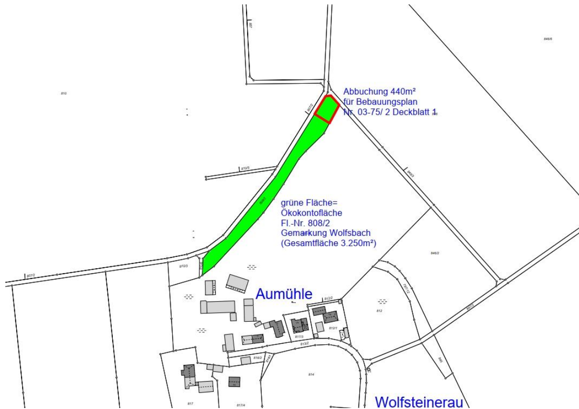
Abbildung 3: Lageplan Ausgleichsfläche Fl.-Nr. 808/2 Gemarkung Wolfsbach, mit Kennzeichnung der für den Eingriff abzubuchenden Fläche von 440 m 2 , ohne Maßstab.

440 m 2 auf Fl.-Nr. 808/2 Gem. Wolfsbach x Faktor 1,0 Ermittelter Ausgleichsflächenbedarf gemäß Abbildung 2 = Bilanz/ Differenz