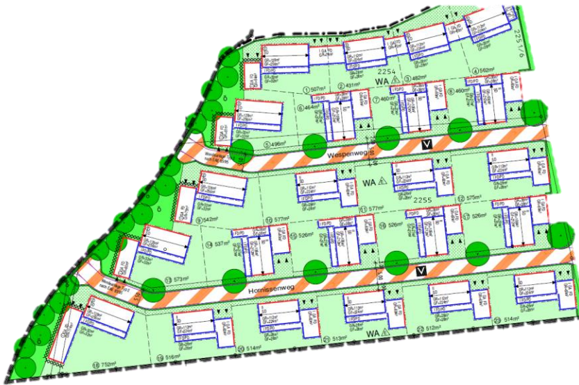
Abb. 1 (Bebauungsplan Nr. 02-29d Deckblatt 1/Ausschnitt)

Es wurde festgestellt, dass die im räumlichen Geltungsbereich des Bebauungsplanes Nr. 02-29d Deckblatt 1 festgesetzten Verkehrsflächen noch nicht gewidmet sind.