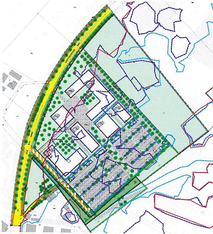
Abb. 1 (Bebauungsplan Nr. 07-70)