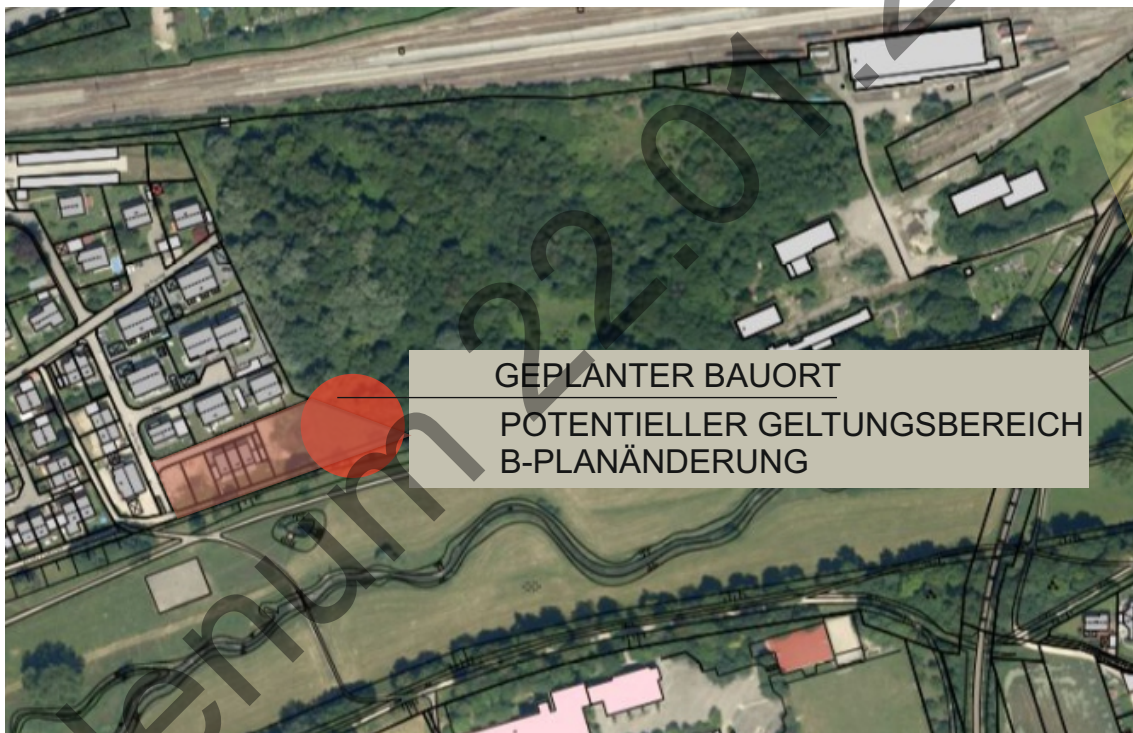
Abbildung 1: Lageplan mit Luftbild (Amt für Stadtentwicklung und Stadtplanung der Stadt Landshut)

Der Bebauungsplan Nr. 03-75/2 „Löschchenbrand Erweiterung Ost“ befindet sich zwischen der Flutmulde und der Gleisanlage der Bahnlinie Landshut – München, westlich des Hauptbahnhofs. Im Osten grenzt das Gebiet an den Bahnhofswald an. Der Bebauungsplan hat eine Größe von ca. 17.700 m 2 und umfasst das Gebiet westlich und zum Teil östlich der Heubergerstraße. Die vom Antrag betroffene Fläche befindet sich zwischen dem Bebauungsplanumgriff und dem Bahnhofswald und ist Teil der Flurnr.: 1227. Es wird beabsichtigt Baurecht für ein Einfamilienhaus mit Garage sowie einem erdgeschossigen Anbau zu schaffen.