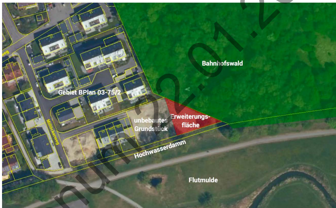
Abbildung 3: Lage der Erweiterungsfläche (nicht parzellenscharf) zwischen Bahnhofswald und dem Gebiet des Bebauungsplan 03-75/2

Der benachbarte Bahnhofswald ist, wie zuvor festgehalten, ein sehr wertvoller Lebensraum mit einem Bestand von seltenen, gefährdeten und besonders schutzwürdigen Arten. Im Rahmen dieser Vorabschätzung wurden die europarechtlich geschützten Arten betrachtet. Eine Auswirkung auf weitere Arten ist nicht Bestandteil.