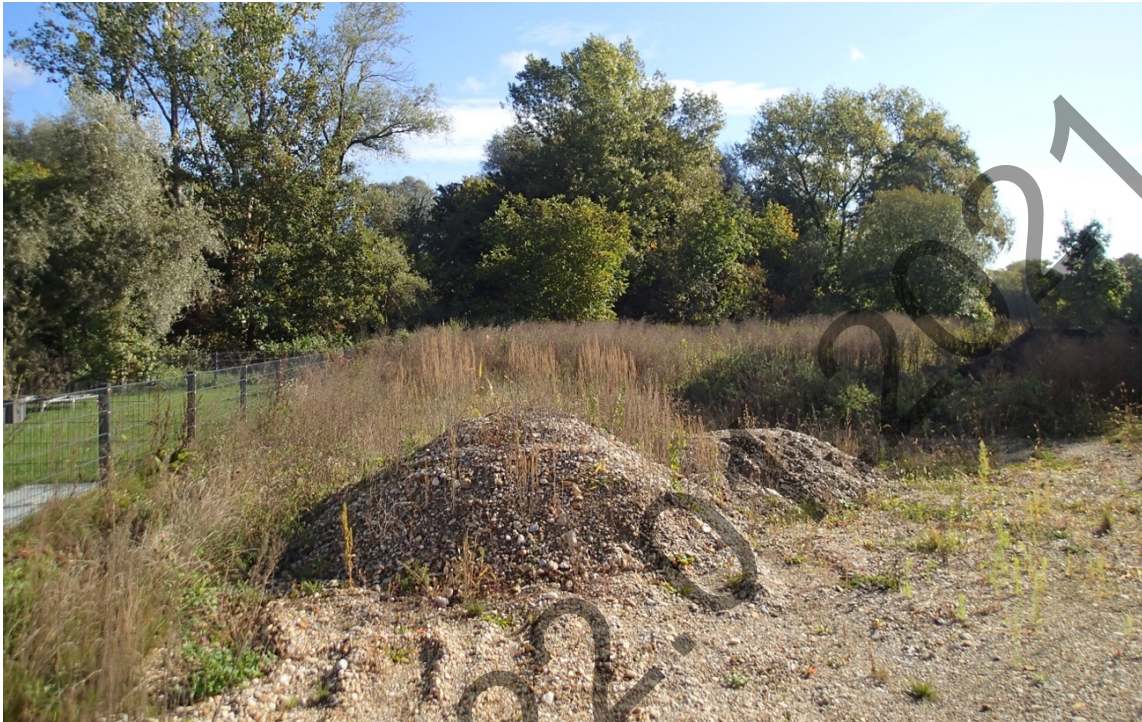
Abbildung 4: Unbebautes Grundstück westlich, dahinter liegend gegenständliche Fläche vor dem Bahnhofswald

Im Osten angrenzend befindet sich der Bahnhofswald, der in diesem Bereich Lichtungen und Totholz sowie Gehölze mit Habitatfunktion aufweist, wie zum Beispiel eine Weide mit Spechthöhle. Kleine Stühlchen und Kletterhilfen an einem Baum zeugen von der Aneignung und Nutzung des Waldrandes durch angrenzende Bewohner.