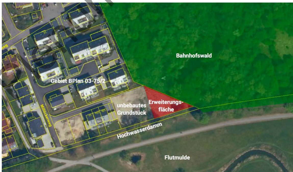
Abbildung 3: Lage der Erweiterungsfläche (nicht parzellenscharf) zwischen Bahnhofswald und dem Gebiet des Bebauungsplan 03-75/2

Die Erweiterungsfläche ist als Saum mit artenarmer ausdauernder Staudenflur, nährstoffreicher Ausprägung, einzustufen. Die Vegetationsdecke des Bestandes ist sehr dicht und besteht vorwiegend aus Altgras mit Goldrute, Schmetterlingsflieder, Brombeere, Winde, Quecke und Holzzahn sowie Hartriegelaufwuchs. Gemäß Mitteilung des Umweltamt wurde die Fläche in den vergangenen Jahren regelmäßig gemäht, zuletzt vermutlich 2016/2018. Bis auf eine junge Walnuss wachsen auf der Fläche keine Bäume und sie ist auch nicht kronenüberschirmt.