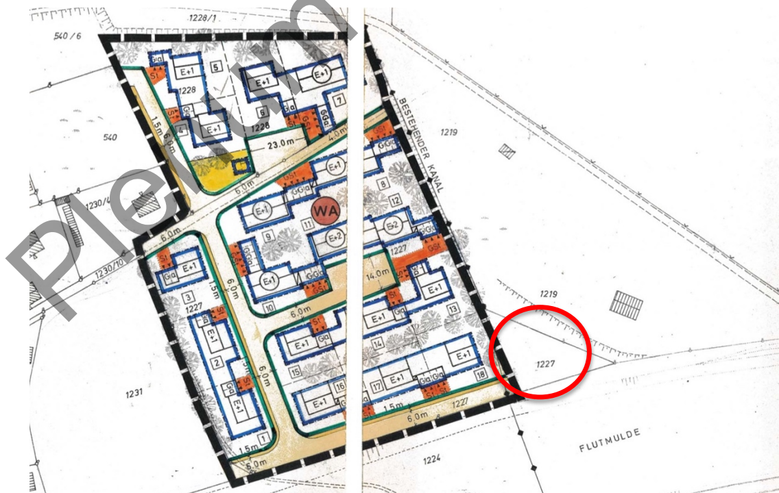
Abbildung 5: Bebauungsplan Nr. 03-75/2, 26.07.1973 ( www.stadtplan.landshut.de ) mit potenzieller Erweiterung (rot)