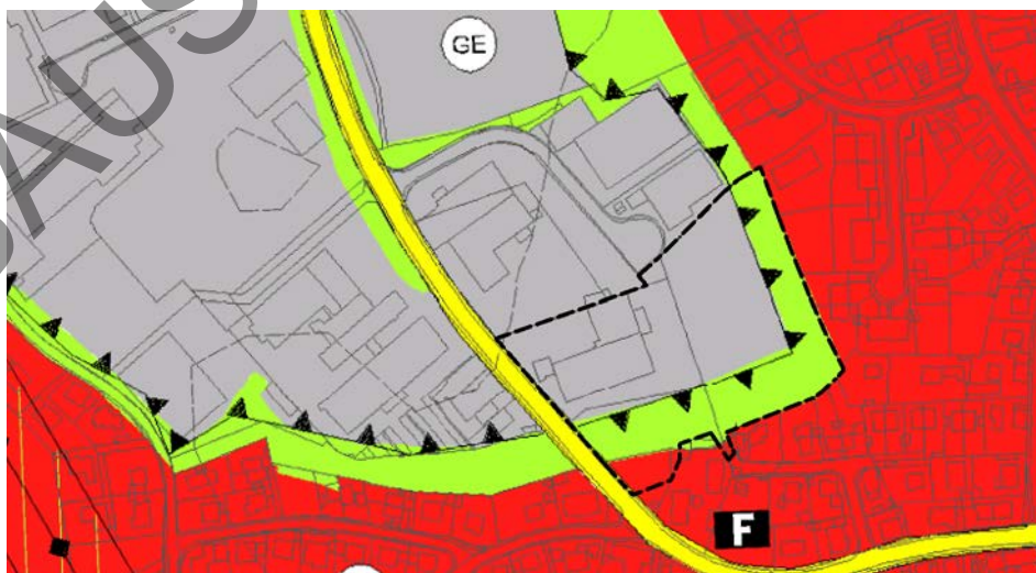
Abbildung 1: Ausschnitt aus dem rechtswirksamen Flächennutzungsplan Landshut, unmaßstäblich, mit Darstellung des Geltungsbereichs für den Bebauungsplan

Der vorliegende Bebauungsplan entspricht somit nicht der Darstellung des Flächennutzungsplans. Im beschleunigten Verfahren kann jedoch ein Bebauungsplan auch aufgestellt werden, bevor der Flächennutzungsplan geändert oder ergänzt ist. Die Berichtigung des Flächennutzungsplanes erfolgt durch ein separates Deckblatt.