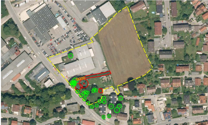
Abbildung 5: Luftbildausschnitt mit Gehölbewertung 6/2018, EGL, unmaßstäblich mit Darstellung des Geltungsbereichs für den Bebauungsplan (Erhaltungswert: grün = hoch, orange = mittel, rot = gering)