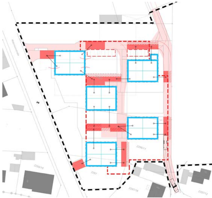
Abbildung 6: Konzept mögliche Lage und Führung Feuerwehrezufahrten und Aufstellflächen, unmaßstäblich; EGL 10/2019.