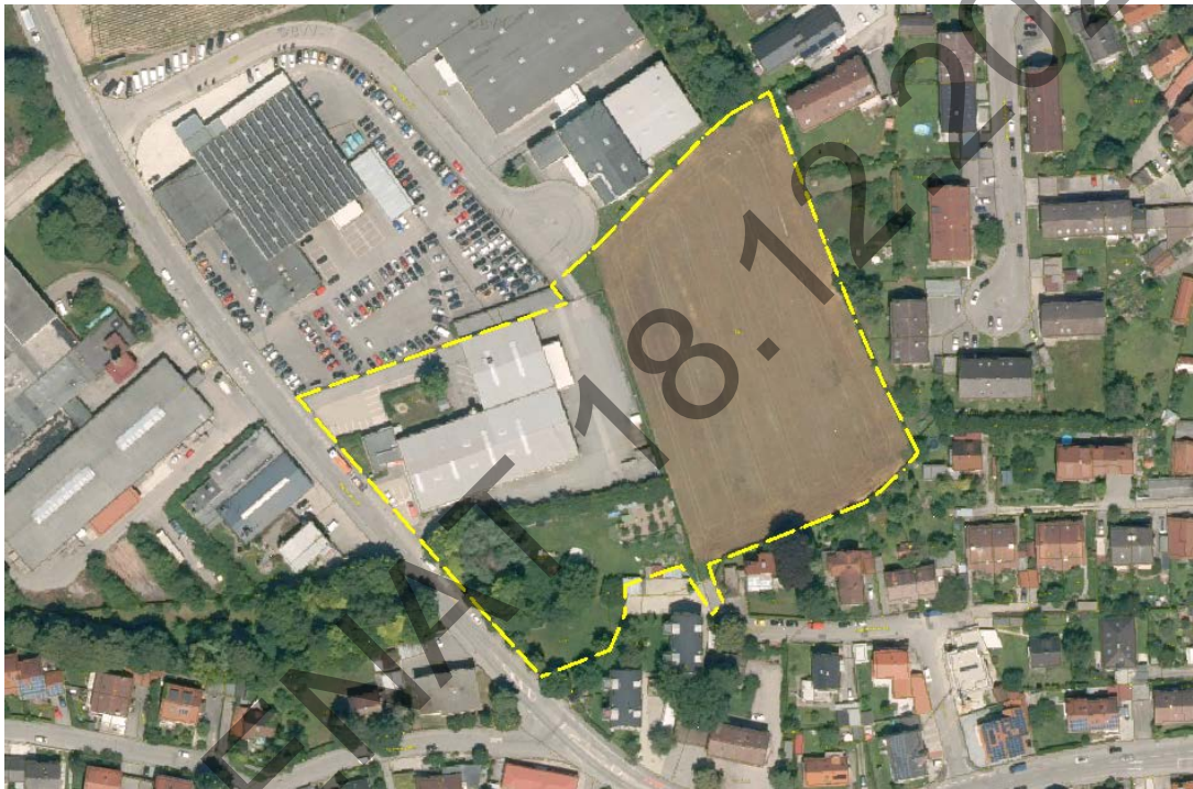
Abbildung 4: Bestandssituation und Umgebungsbebauung, Auszug aus BayernAtlas 6/2019, unmaßstäblich, mit Darstellung des Geltungsbereichs für den Bebauungsplan