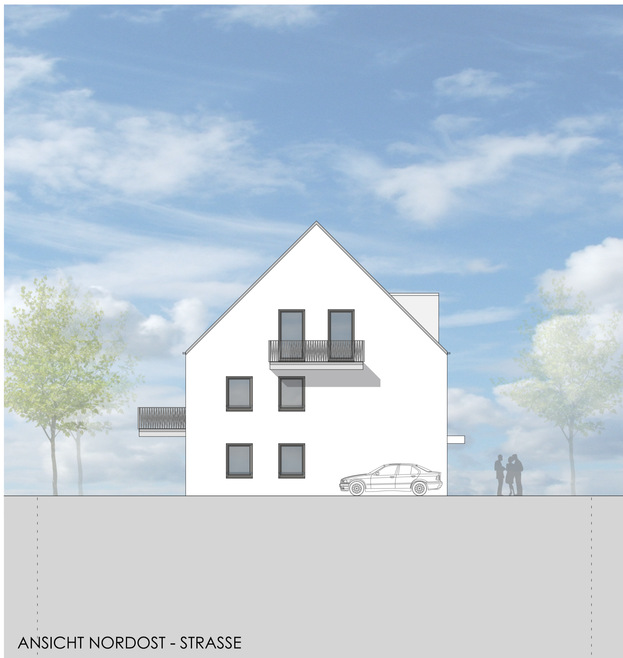
ANSICHT NORDOST - STRASSE