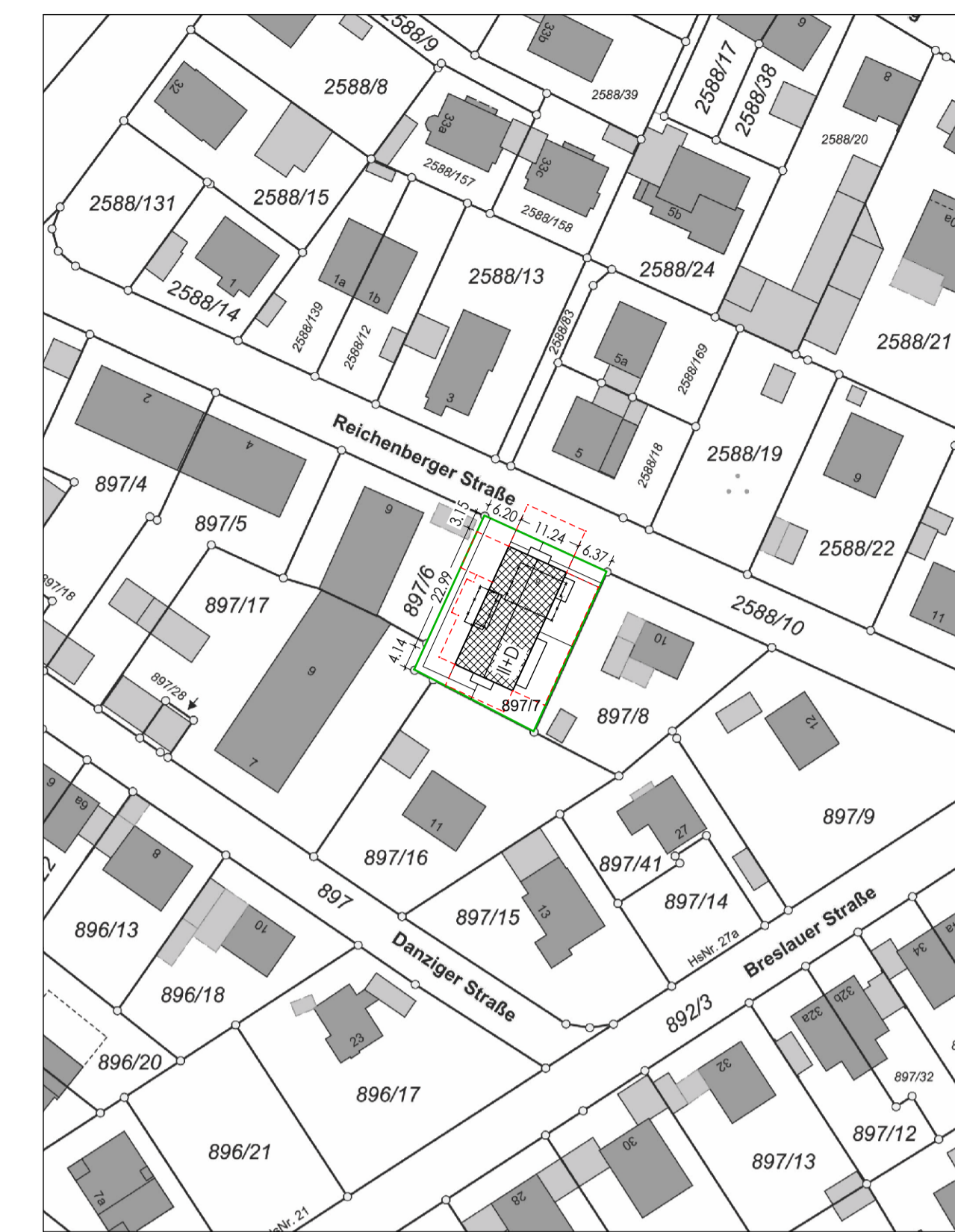
Lageplan M 1:1000