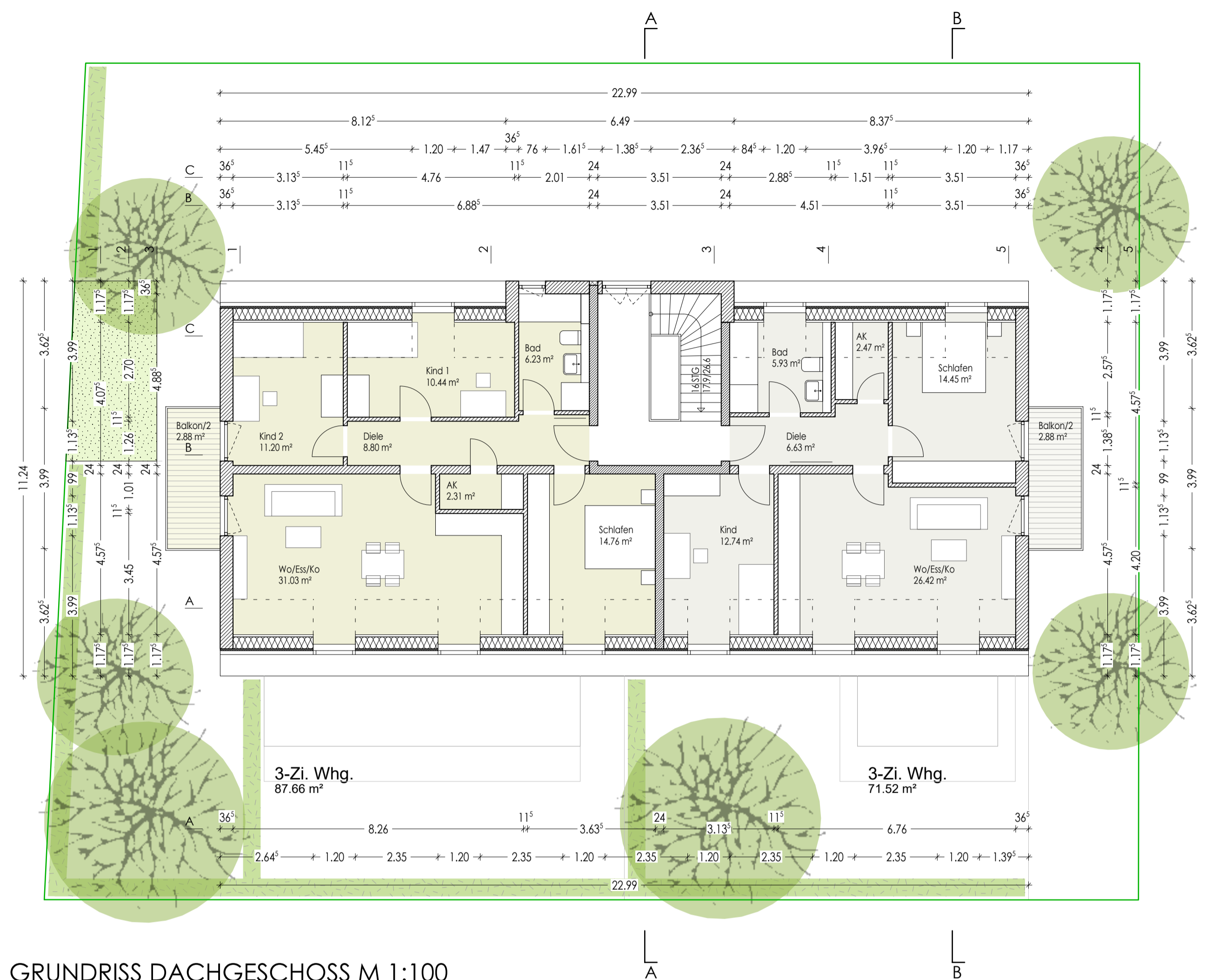
GRUNDRISS DACHGESCHOSS M 1:100