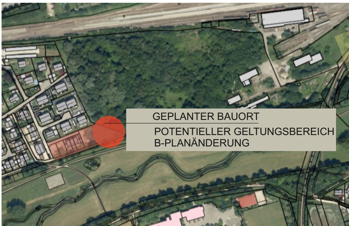
Abbildung 1: Lageplan mit Luftbild (Amt für Stadtentwicklung und Stadtplanung der Stadt Landshut)

Der Bebauungsplan Nr. 03-75/2 „Löschchenbrand Erweiterung Ost“ befindet sich zwischen der Flutmulde und der Gleisanlage der Bahnlinie Landshut – München, westlich des Hauptbahnhofs. Im Osten grenzt das Gebiet an den Bahnhofswald an. Der Bebauungsplan hat eine Größe von ca. 17.700 m 2 und umfasst das Gebiet westlich und zum Teil östlich der Heubergerstraße. Die vom Antrag betroffene Fläche befindet sich zwischen dem Bebauungsplanumgriff und dem Bahnhofswald und ist Teil der Flurnr.: 1227. Es wird beabsichtigt Baurecht für ein Einfamilienhaus mit Garage sowie einem erdgeschossigen Anbau zu schaffen.