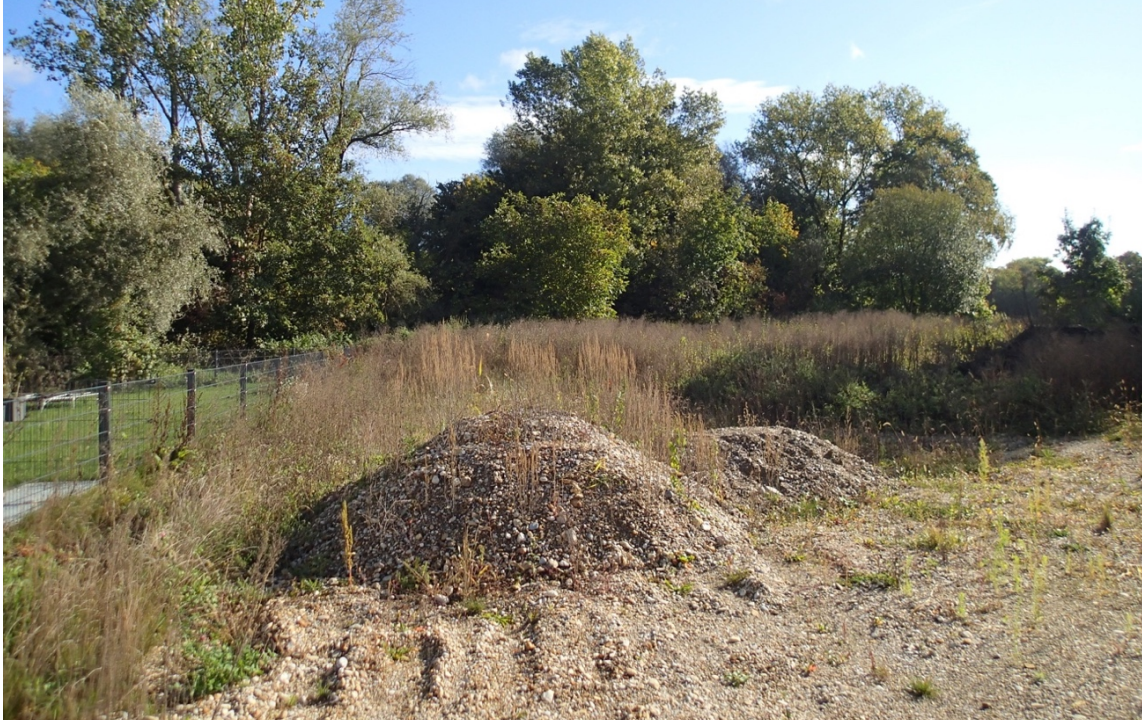
Abbildung 4: Unbebautes Grundstück westlich, dahinter liegend gegenständliche Fläche vor dem Bahnhofswald

Im Osten angrenzend befindet sich der Bahnhofswald, der in diesem Bereich Lichtungen und Totholz sowie Gehölze mit Habitatfunktion aufweist, wie zum Beispiel eine Weide mit Spechthöhle. Kleine Stühlchen und Kletterhilfen an einem Baum zeugen von der Aneignung und Nutzung des Waldrandes durch angrenzende Bewohner.