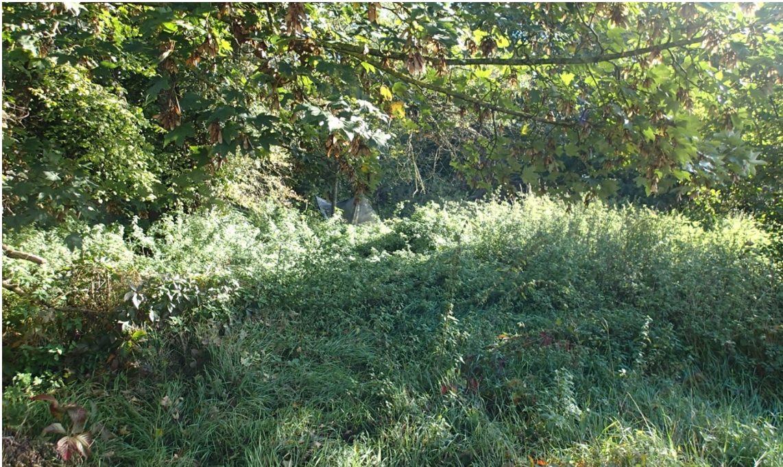
Abbildung 2: Blick auf das gegenständliche Teil-Flurstück mit Altgrasbestand und angrenzendem Bahnhofswald

Die Erweiterungsfläche ist als Saum mit artenarmer ausdauernder Staudenflur, nährstoffreicher Ausprägung, einzustufen. Die Vegetationsdecke des Bestandes ist sehr dicht und besteht vorwiegend aus Altgras mit Goldrute, Schmetterlingsflieder, Brombeere, Winde, Quecke und Hohlzahn sowie Hartriegelaufwuchs. Gemäß Mitteilung des Umweltamt wurde die Fläche in den vergangenen Jahren regelmäßig gemäht, zuletzt vermutlich 2016/2018. Bis auf eine junge Walnuss wachsen auf der Fläche keine Bäume und sie ist auch nicht kronenüberschirmt.