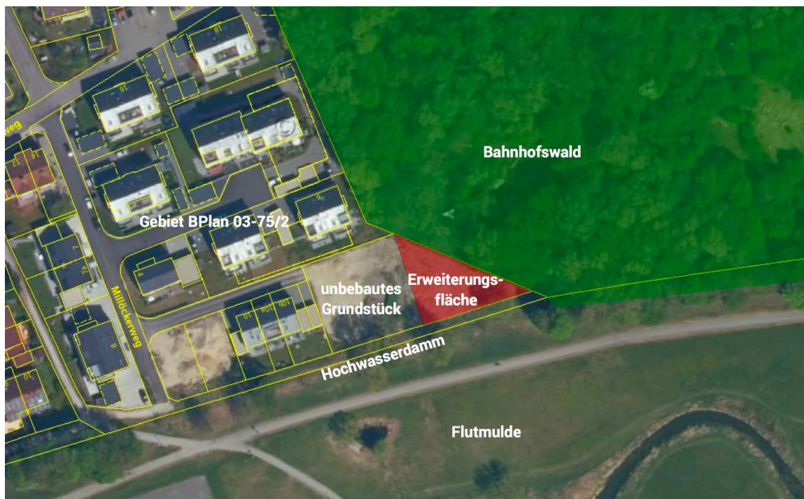
Abbildung 3: Lage der Erweiterungsfläche (nicht parzellenscharf) zwischen Bahnhofswald und dem Gebiet des Bebauungsplan 03-75/2

Der benachbarte Bahnhofswald ist, wie zuvor festgehalten, ein sehr wertvoller Lebensraum mit einem Bestand von seltenen, gefährdeten und besonders schutzwürdigen Arten. Im Rahmen dieser Vorabschätzung wurden die europarechtlich geschützten Arten betrachtet. Eine Auswirkung auf weitere Arten ist nicht Bestandteil.