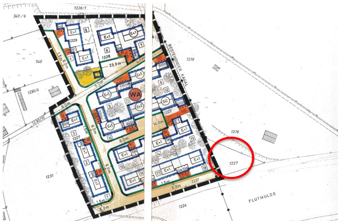
Abbildung 5: Bebauungsplan Nr. 03-75/2, 26.07.1973 ( www.stadtplan.landshut.de ) mit potenzieller Erweiterung (rot)