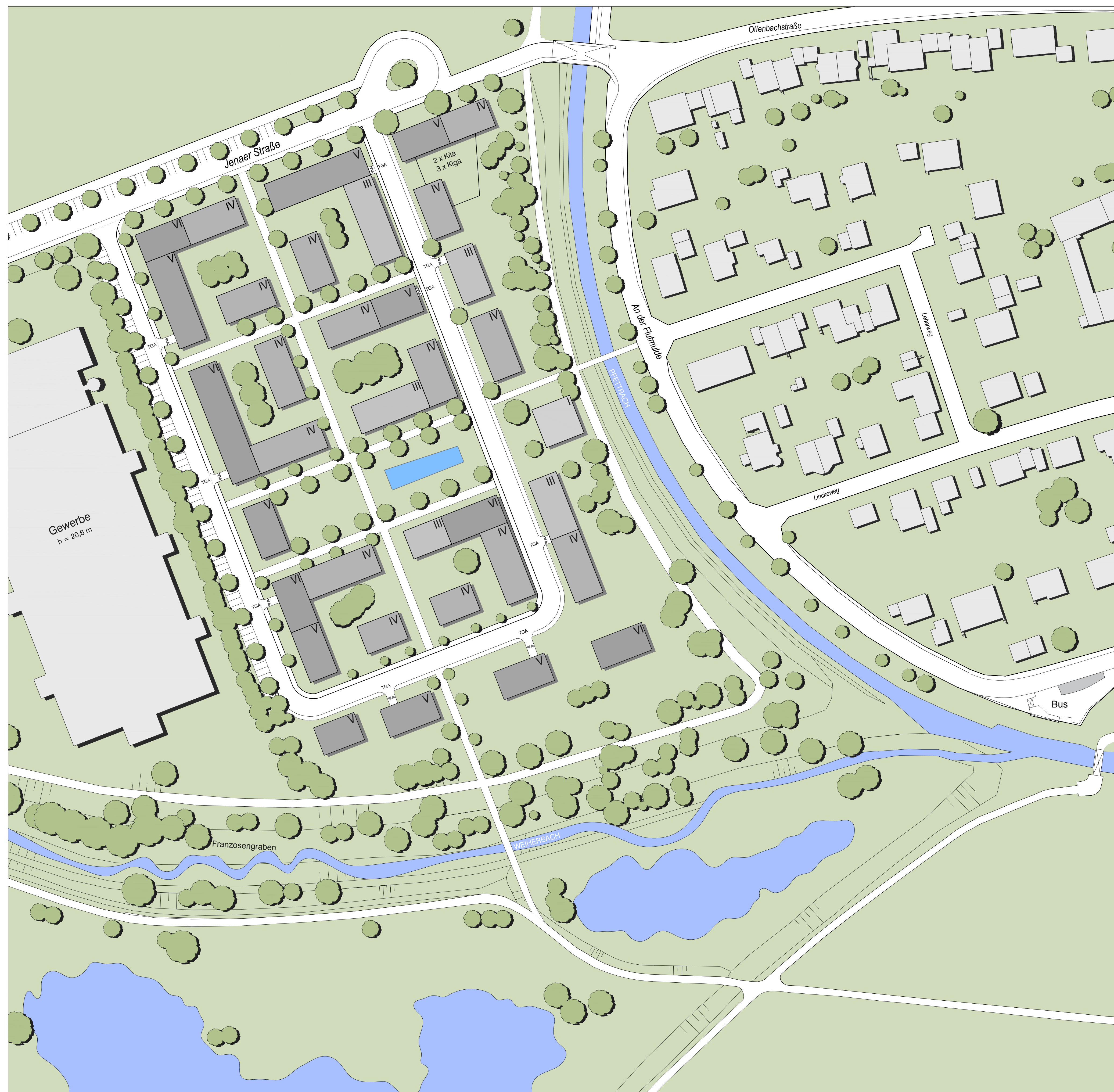
Lageplan M 1 | 750