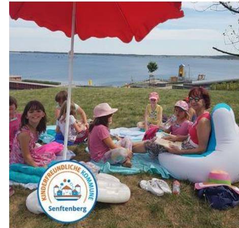
Lesen am See Senftenberg