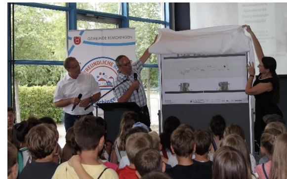
Präsentation der fertigen Pläne