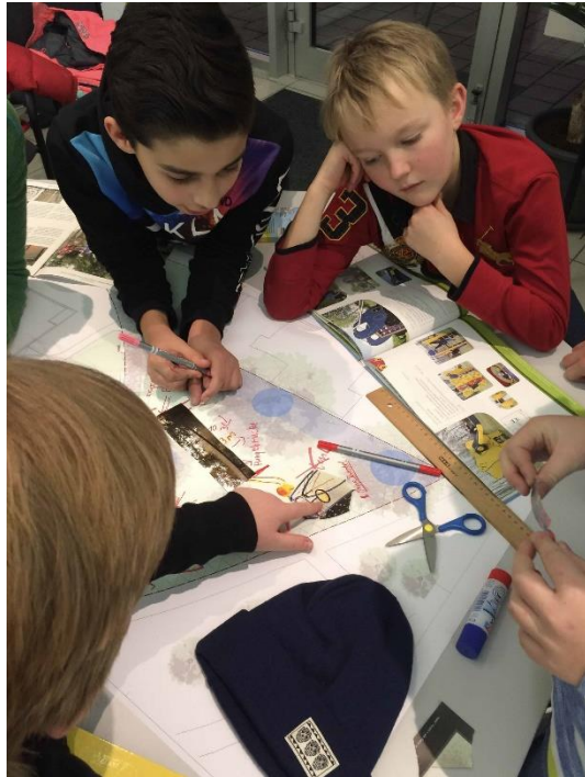
Die Kinder beim Spielplatz-Check