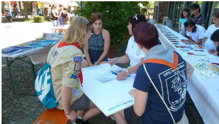
Pro Action Cafe in der Innenstadt