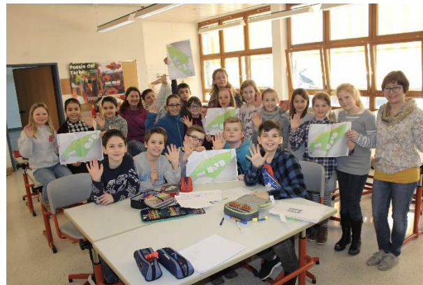
Schüler_innen entwickeln gemeinsam Ideen