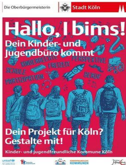
Kinder- und Jugendbüro Köln