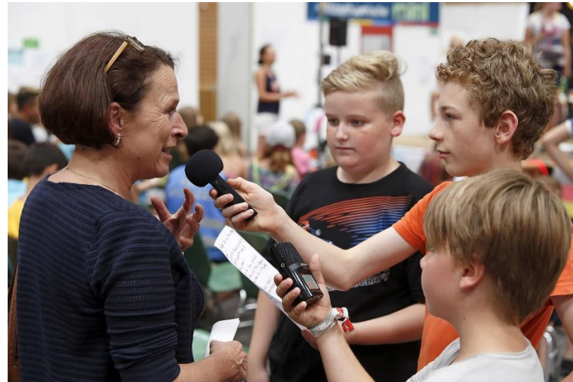
Kinderreporter bei Mini-Regensburg unterwegs