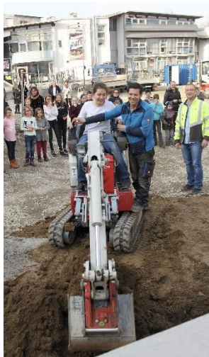
Beginn der Bauarbeiten