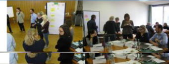
Beteiligungskonzept Weil am Rhein

Verwaltungsleitfaden Kinder- und Jugendbeteiligung