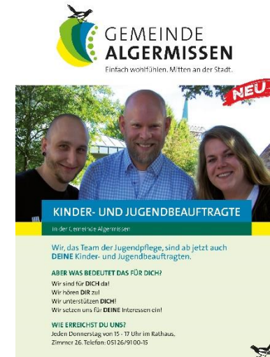
Kinder- und Jugendbeauftragte