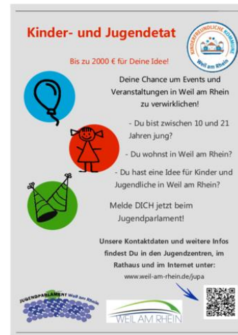
Kinder- und Jugendetat Weil am Rhein