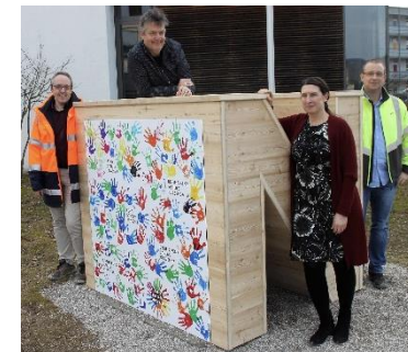
Der erste fertige Buchstabe