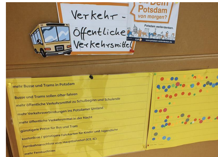
500 Kinder und Jugendliche nahmen teil