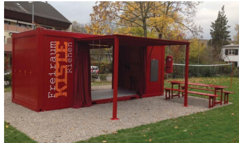
Der fertige überdachte Treffpunkt mit Sitzmöglichkeiten