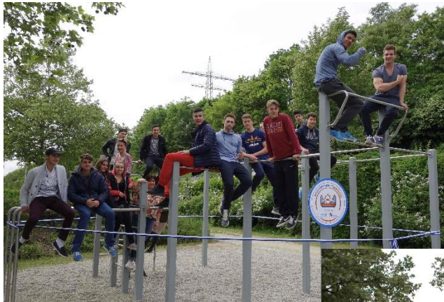
Jugendliche gestalten Street Workout Park