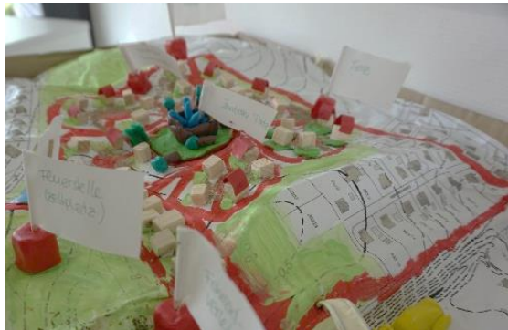
Beteiligung B-Plan Wedemark