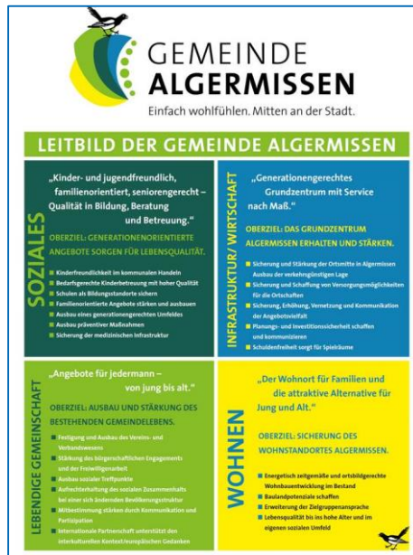
Leitbild der Gemeinde Algermissen