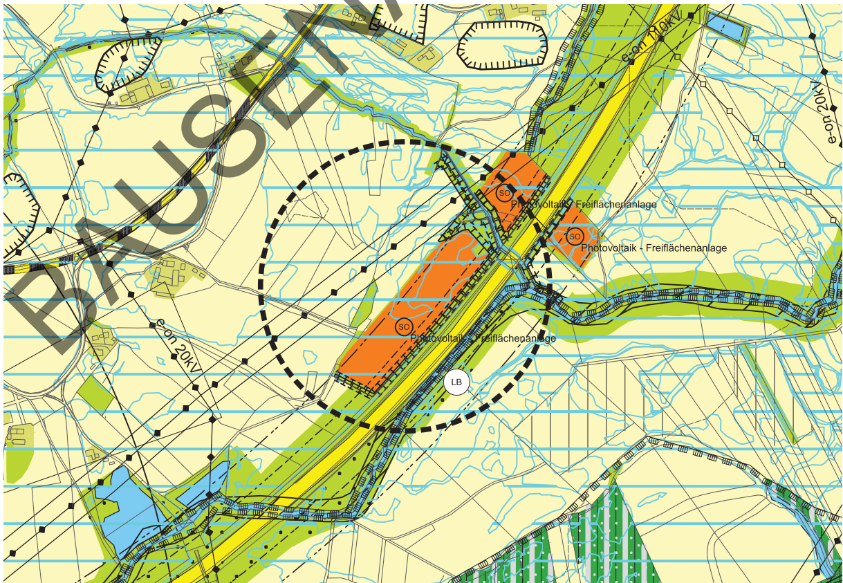
Änderung Flächennutzungsplan mit Deckblatt Nr. 62 im Bereich "Westlich der Autobahn A92 - südlich Seebach"