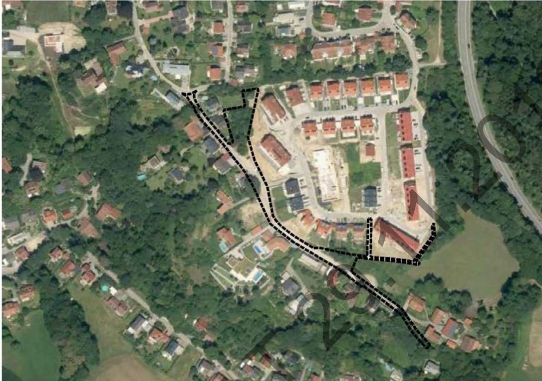
Luftbild der Bayerischen Vermessungsverwaltung mit Darstellung Geltungsbereich

Das Planungsgebiet liegt im Bereich Moniberg Süd im Stadtteil Peter und Paul und umfasst ca. 4.920 m 2 .