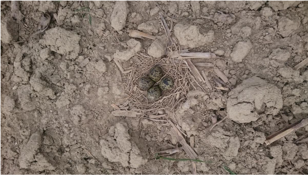
Kiebitz-Gelege mit vier Eiern