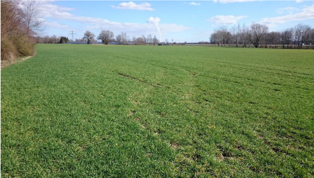
Geplanter Standort für die PV-Anlage Ende März und