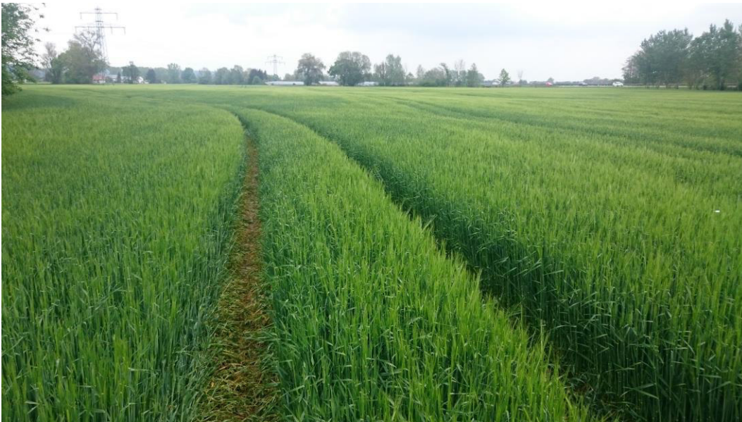
Anfang Mai 2019