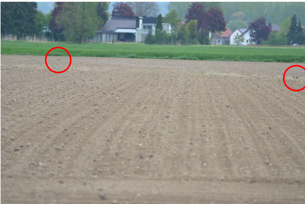
Acker mit zwei brütenden Kiebitzen